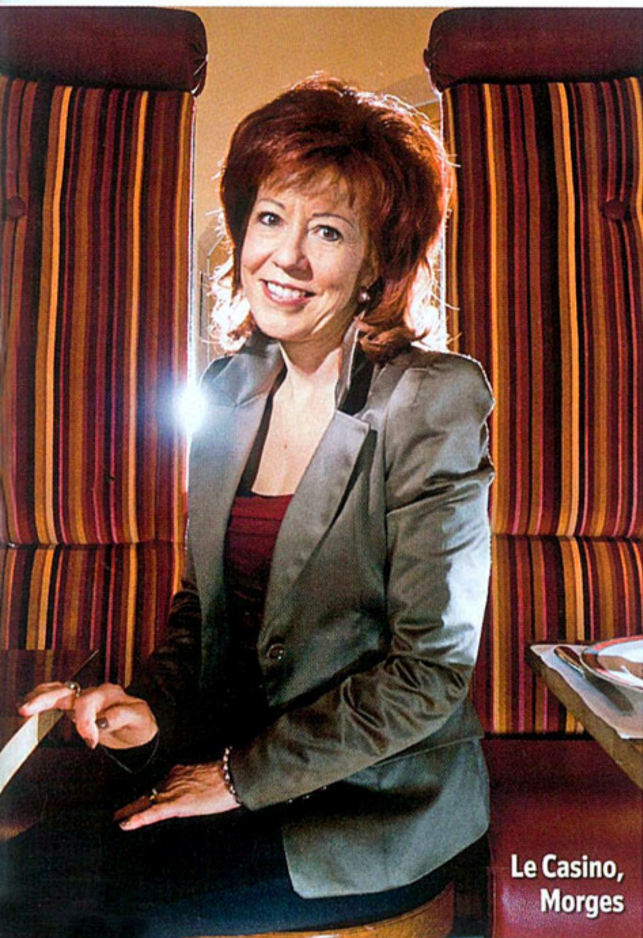
Le Casino, Morges